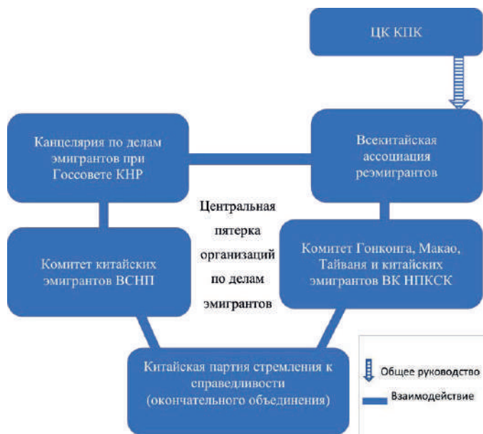
Рис. 3. Организационная схема ключевого аппарата КНР по работе с китайской диаспорой с марта 2018 г. Составлено автором

название, Канцелярия по делам китайских эмигрантов при Госсовете КНР (в структуре Госсовета этого структурного подразделения уже нет) (см. рис. 3).