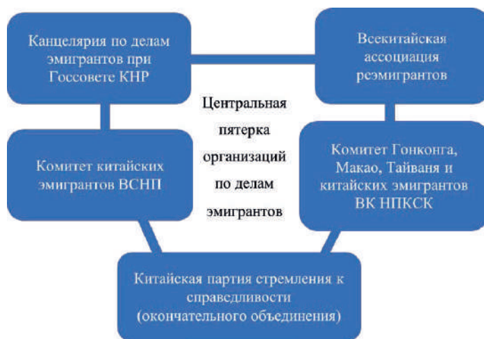
Рис. 1. Организационная схема ключевого аппарата КНР по работе с китайской диаспорой до декабря 2016 г. Составлено автором

Основную работу с китайской диаспорой в КНР ведёт так называемая центральная пятёрка организаций по делам эмигрантов ( чжунъян у цяо 中央五侨), далее – центральная пятёрка (см. рис. 1): Канцелярия по делам эмигрантов при Госсовете КНР ( Го-у-юань цяо-у баньгунши 国务院侨务办公室), Всекитайская ассоциация реэмигрантов ( Чжунхуа цюаньго гуйго хуацяо лянхэхуэй 中华全国归国华侨联合会), Комитет китайских эмигрантов ВСНП ( Цюаньго жэньминь дайбяо дахуэй хуацяо вэйюаньхуэй 全国人民代表大会华侨委员会), Комитет Гонконга, Макао, Тайваня и китайских эмигрантов ВК НПКСК ( Цюаньго чжэнсе Ган-Ао-Тай цяо вэйюаньхуэй 全国政协港澳台侨委员会) и Китайская партия стремления к справедливости ( Чжунго Чжигундан 中国致公党) – альтернативный перевод названия данной партии на русский язык – Партия окончательного объединения (доведения до конца единения) Китая был озвучен д-ром филос. наук, проф. А. И. Кобзевым (ИВ РАН) на ЛП научной конференции «Общество и государство в Китае» 18 мая 2022 г.).