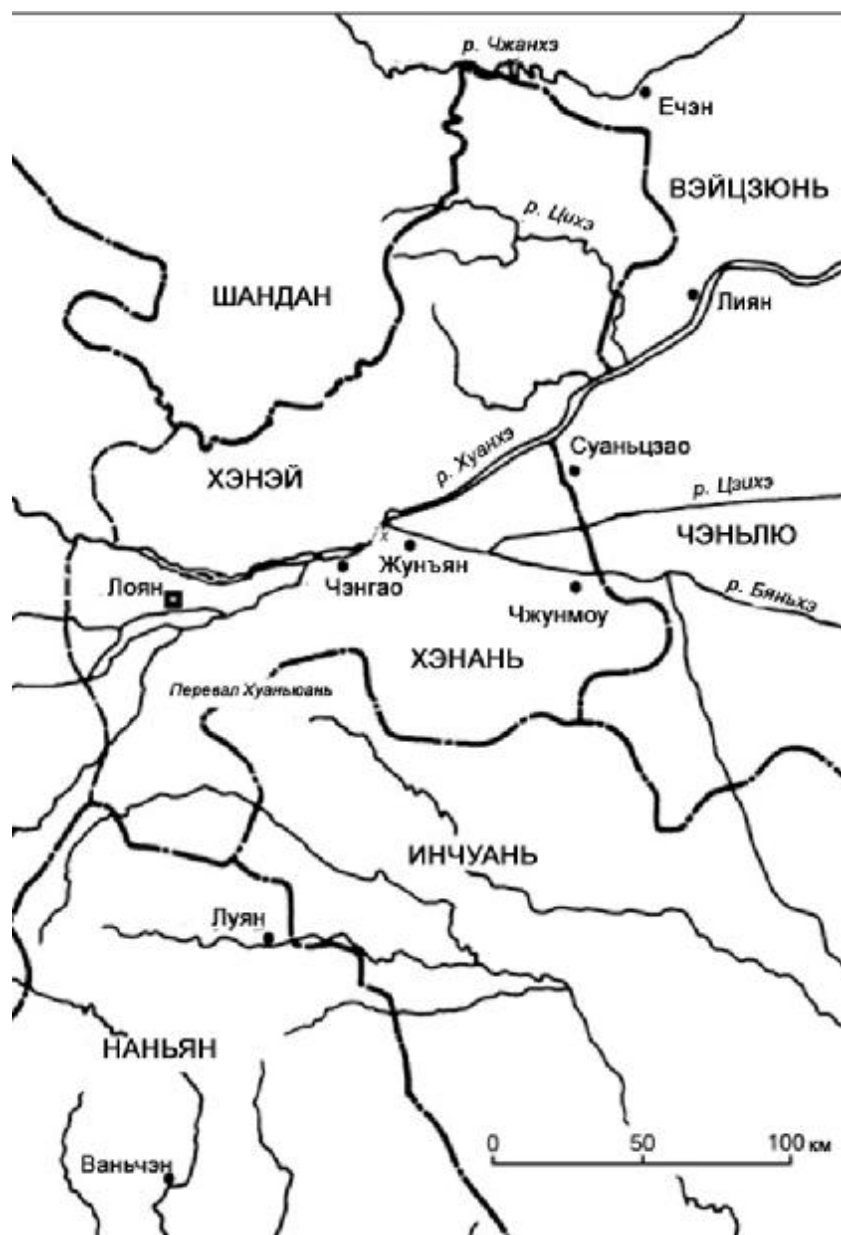
Рис. 2. Карта окрестностей Лояна во время кампании 190–191 гг.