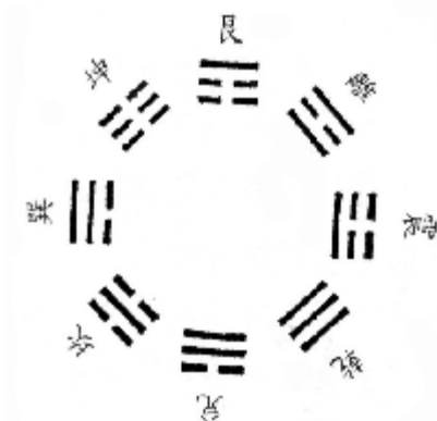
Рис. 1. Схема восьми триграмм Лянь шань Шэнь-нуна

не, то получатся четыре пары триграмм, в каждой из которых, триграммы противоположны друг другу, или «сбалансированы».