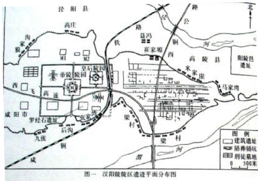
Рис. 1. Общая схема мавзолея Янлин и прилегающих объектов (см. [10, с. 80]).