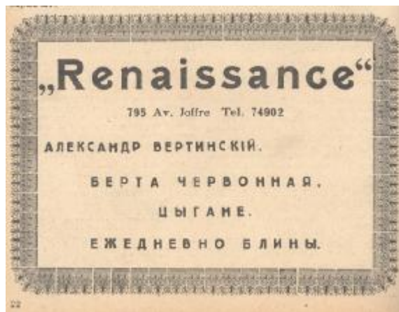
Илл. 8. Журнал «Кстати». Шанхай, 9 марта 1940. № 11

Берта Червонная в своих танцах. Оркестр Вл. Ульштейна. Знаменитые шашлыки! Лучшая кухня в городе. Обеды с 12 часов дня» 26 .