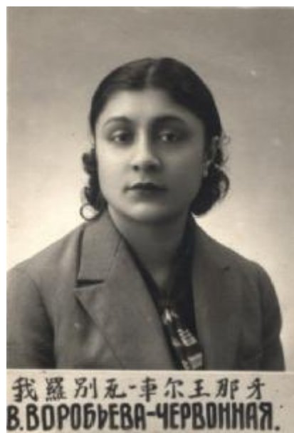
Илл. 6. Анкета БРЭМ, Берга Воробьева-Червоная, ГАХК Ф. 830. Оп. 3. Д. 51700, л. 1