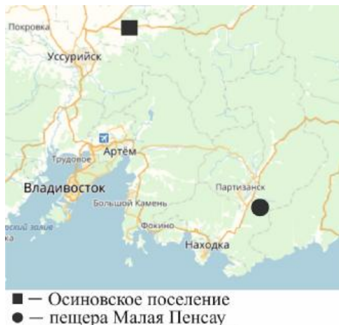
Рис. 1. Карта памятников династии Юань в Приморье

в пещере произведены небольшие раскопки [6]. Пещера находилась на правом берегу р. Малая Пенсау, в 3,5 км от её впадения в р. Партизанскую (рис. 1).